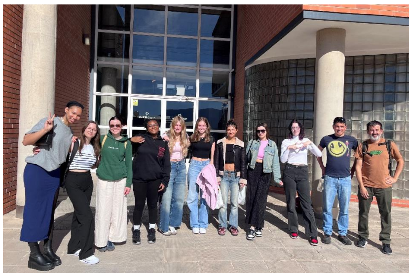
Zu Gast im Innovations- und Technologiezentrum INESCOP

Zu Beginn des Tages besuchten die neun Mädels mit ihren jeweiligen Gastgeberinnen den Unterricht. Anschließend standen täglich verschiedene Exkursionen auf dem Programm. So wurden wir im INESCOP (Zentrum für Innovation und Technologie im Schuhsektor) über die aktuellen Entwicklungen und Herausforderungen in der Lederschuh-Produktion informiert. Besonders interessant war der Circular Economy Demonstrator, der einige Recyclingmöglichkeiten für Schuhe, Spielzeug und Textilien aufzeigte. Der Besuch wurde durch eine Tour durch verschiedene Labore abgerundet, deren Fokus darauf liegt, einerseits durch Produktinnovationen den Bedürfnissen der Kunden angepasste Schuhe zu entwickeln, andererseits die Herstellverfahren ökologisch nachhaltiger zu gestalten.